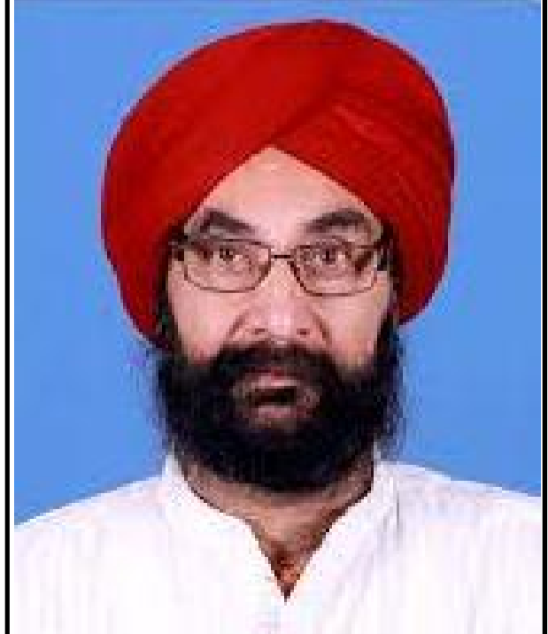
ସନ୍ତୋଷ ସିଂ ପ୍ରାଲୁଜା ବିଧାୟକ, କଟାକାଞ୍ଜି

ଶିବ-ପାର୍ବତୀଙ୍କ ବିବାହୋତ୍ସବ ଶୀତଳଷଷ୍ଠୀ ପର୍ବ ଅବସରରେ କଟାକାଞ୍ଜି ନିର୍ବାଚନ ମଞ୍ଚଳାର ସମସ୍ତ ଜନସାଧାରଣଙ୍କୁ ଅଭିନନ୍ଦନ ।