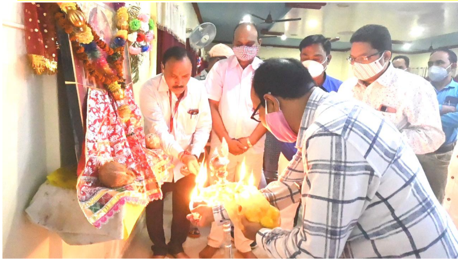
ଅତିଥିମାନଙ୍କ ଦ୍ୱାରା ମା' ସମଲେଇଙ୍କଠାରେ ଦୀପ ପ୍ରଦାନ