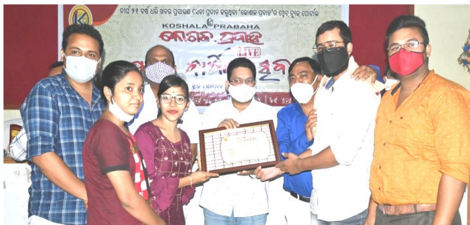
ମାହେଶ୍ଵରୀ ସେବା ସଂଗଠନ, ବଲାଙ୍ଗିର