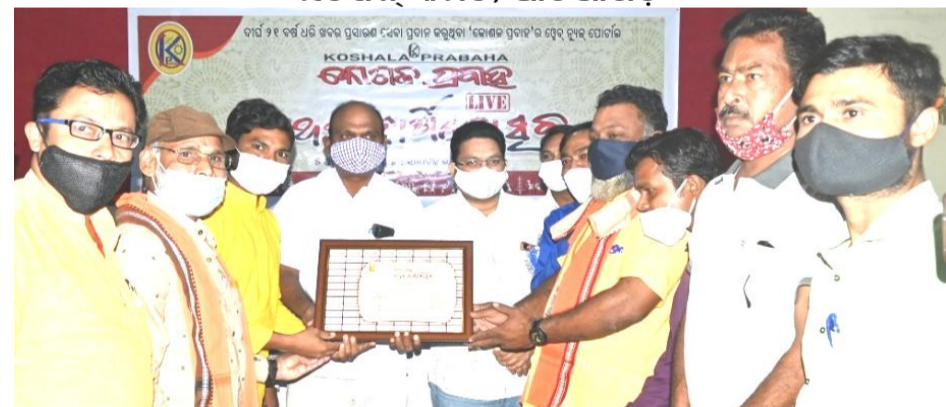
କେଶରୀୟା ହିନ୍ଦୁ ବାହିନୀ, ବଲାଙ୍ଗିର