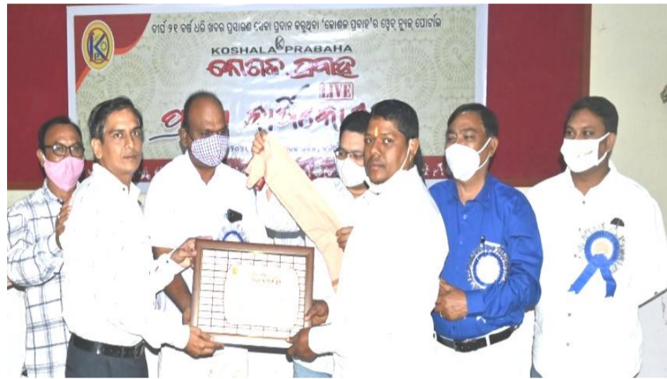
ଗୁରୁକୃପା ସେବା ଟ୍ରଷ୍ଟ, ଚିଟିଲାଗଡ଼