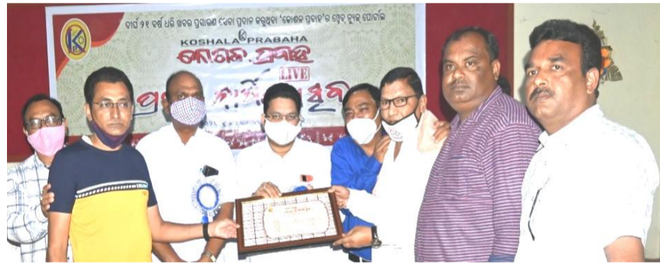
ସିଟିଜନ୍ କମିଟି, ପାଟଣାଗଡ଼