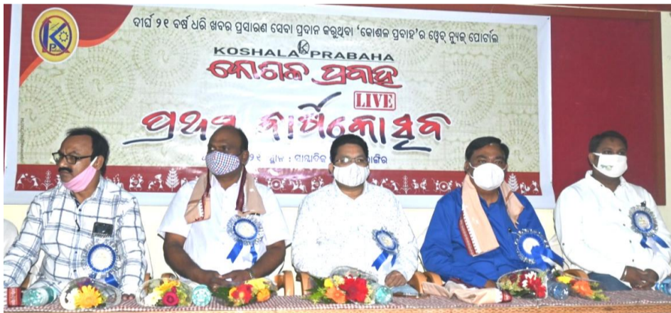
'କୋଶଳ ପ୍ରବାହ ଲାଇଭ୍'ର ପ୍ରଥମ ବାର୍ଷିକୋତ୍ସବ ମଠରେ ମହାସମାନ ଅତିଥି ବୃନ୍ଦ