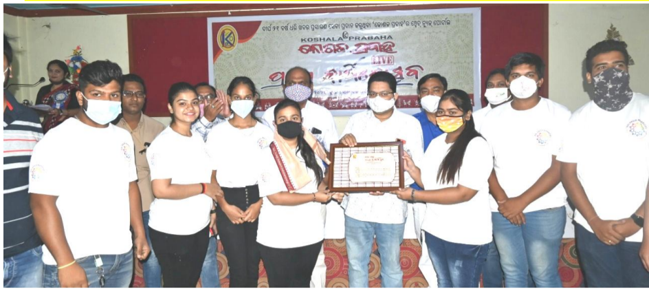
ସିଏନ୍ସି ବାଣିଜ୍ୟ ମହାବିଦ୍ୟାଳୟର ଛାତ୍ରଛାତ୍ରୀ ସମୂହ, ବଲାଙ୍ଗିର