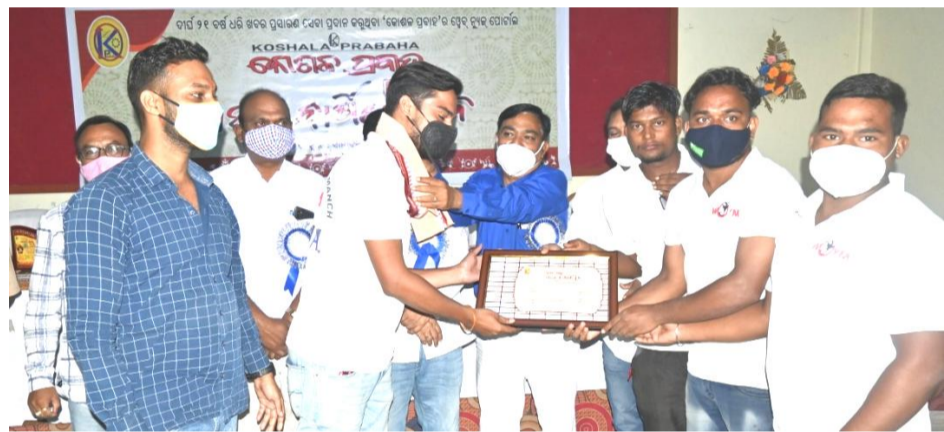
ଢ୍ଢେଷ୍ଟର୍ ଡ଼ିଡ଼ିଶା ସୁବା ନୀର, ବଲାଙ୍ଗିର