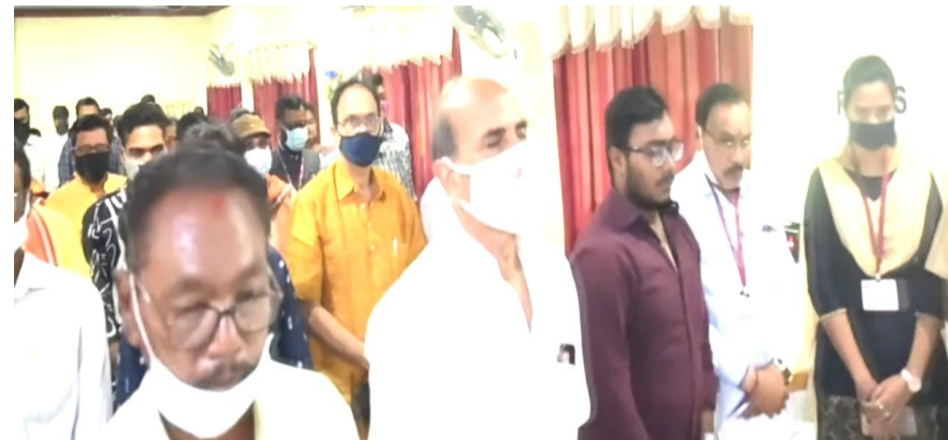
ଦିବଙ୍ଗତ ସାମ୍ବାଦିକଙ୍କୁ ଶ୍ରଦ୍ଧାଞ୍ଜଳି ଭଜେଣ୍ୟରେ ନୀରବ ପ୍ରାର୍ଥନା