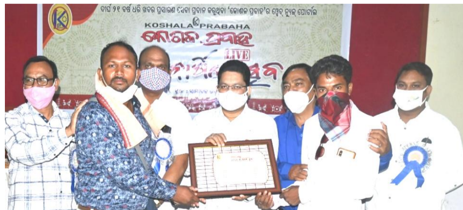
ସେବା ଚେରିଟେଭୁଲ୍ ଟ୍ରଷ୍ଟ, ପାଟଣାଗଡ଼