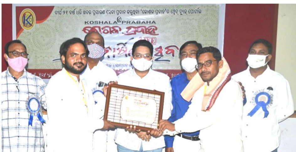
ବଲାଙ୍ଗିର ସେଛାସେବୀ ସଂଗଠନ, ବଲାଙ୍ଗିର