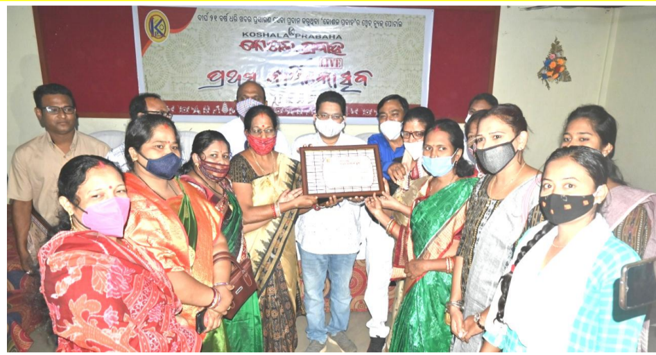
ନାରୀଶକ୍ତି ପାଠଶ୍ରେୟନ, ବଲାଙ୍ଗିର