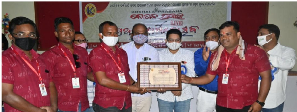
ନିଷ୍ଠା ପରିବାର, ବରଗଡ଼