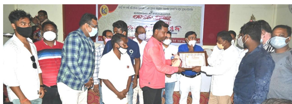
ମାତାରମ ପାଠଶ୍ରେୟନ, ବଲାଙ୍ଗିର