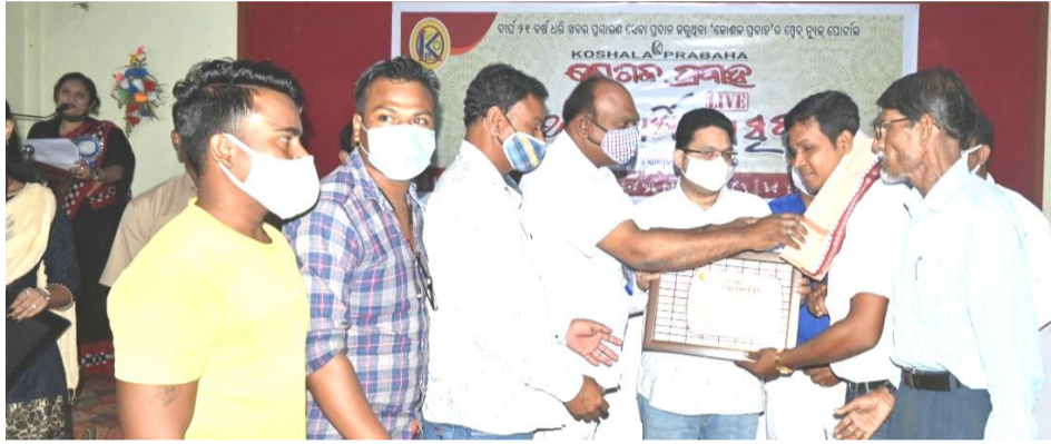
ସ୍କାଇଲ୍ ଫର୍ ଅଲ୍, ବଲାଙ୍ଗିର