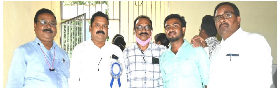
'କୋଶଳ ପ୍ରବାହ ଲାଇଭ୍'ର ପ୍ରଥମ ବାର୍ଷିକୋତ୍ସବର ଏକ ବିଶେଷ ସୁଦୂର୍ଭ