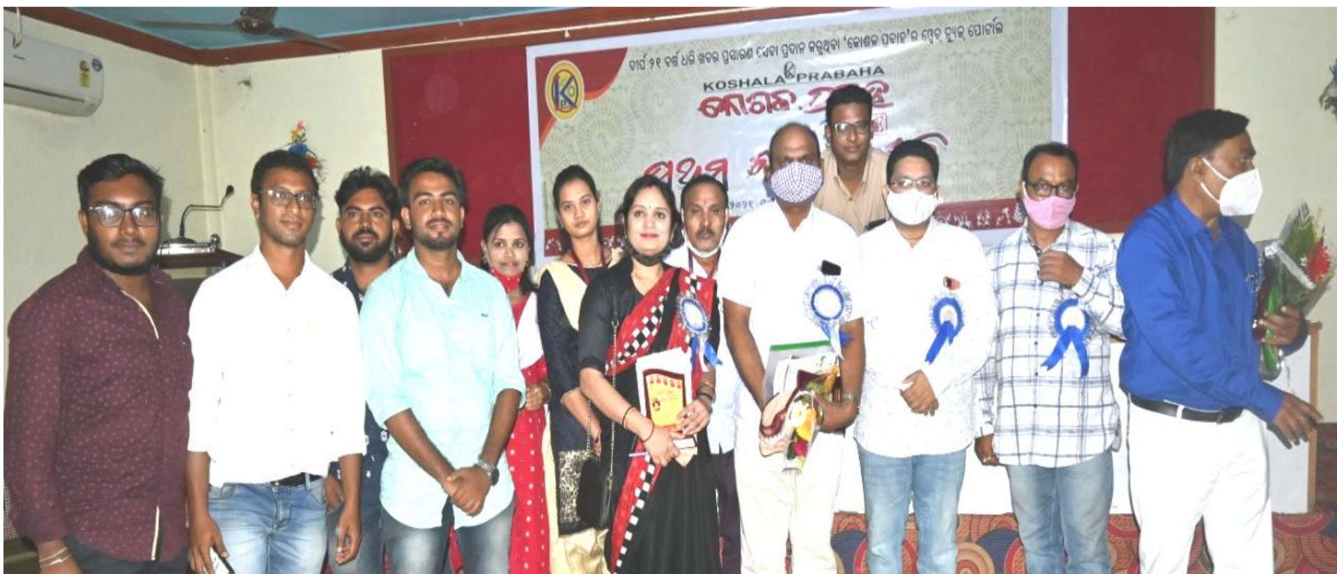
'କୋଶଳ ପ୍ରବାହ ଲାଇଭ୍'ର ପ୍ରଥମ ବାର୍ଷିକୋତ୍ସବରେ ଅତିଥିମାନଙ୍କ ସହ 'କୋଶଳ ପ୍ରବାହ' ସଦସ୍ୟ ବୃନ୍ଦ ।