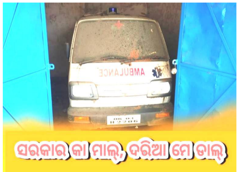
ସରକାର କା ମାଲ୍, ଦରିଆ ମେ ତାଲ୍

ଦେଓଗାଁ, (ନିପ୍ତ) : କରୋନା ମହାମାରୀରେ ଲୋକଙ୍କୁ ମିଳୁନି ଆୟୁଲାନୁ । ସେଥିପାଇଁ କିଏ ସାଇକେଲରେ ଶବ୍ଦ ବୋହୁଛି ତ ପୁଣି କିଏ କାନ୍ଧରେ ବୋହି ନେଉଛି । ହେଲେ ବଲାଙ୍ଗିର ଜିଲ୍ଲା ଦେଓଗାଁ ଗୋଷ୍ଠୀ ସ୍ୱାସ୍ଥ୍ୟ କେନ୍ଦ୍ରରେ ରୋଗୀ ନେବା ଆଣିବା ପାଇଁ ଥିବା ଆୟୁଲାନୁ ଖତ ଖାଉଛି ଗ୍ୟାରେଜ ଭିତରେ, ତାହା ପୁଣି ଭ୍ରାତୃଭର ଅଭାବରୁ । ରୋଗୀ ନ ବୋହି ଡାକ୍ତରଖାନା ଭିତରେ ଦୀର୍ଘ ବର୍ଷ ହେଲା ପତି ରହିଥିବା ଜଣାପଡିଛି । କିନ୍ତୁ ଏହି ଆୟୁଲାନୁଟି କଣ କଲେ କାର୍ଯ୍ୟକ୍ଷମ ହେବ ସେ ବିଷୟରେ ରାଜନେତା କି ସରକାରୀ ଅଧିକାରୀ କେହି ଧ୍ୟାନ ଦେଉ ନ ଥିବାରୁ ସାଧାରଣରେ ଅସନ୍ତୋଷ ଦେଖାଦେଇଛି । ଫଳରେ ଡାକ୍ତରଖାନାରେ ଏହି ଆୟୁଲାନୁକୁ ଦେଖି ଲୋକେ ସରକାର କା ମାଲ୍, ଦରିଆ ମେ ତାଲ୍ ବୋଲି କହିଛନ୍ତି । ସୁତନାଯୋଗ୍ୟ ଯେ, ଗତ ୧୩ ୧୪ ଆର୍ଥିକ ବର୍ଷରେ ସାଂସଦ ପାଣିଗ୍ରାହୀ ଦେଓଗାଁ ଗୋଷ୍ଠୀ ସ୍ୱାସ୍ଥ୍ୟ କେନ୍ଦ୍ରକୁ ଏକ ଆୟୁଲାନୁ ଯୋଗାଇ ଦେଇଥିଲେ ତତ୍କାଳୀନ ବଲାଙ୍ଗିର ସାଂସଦ କଳିକେଶ ନାରାୟଣ ସିଂହ ଦେଓ । କିନ୍ତୁ ଦୀର୍ଘ ୭ ବର୍ଷ ହେଲା ଏହି ଆୟୁଲାନୁଟି ପତିରହିଛି ଗୋଷ୍ଠୀ ସ୍ୱାସ୍ଥ୍ୟ କେନ୍ଦ୍ରର